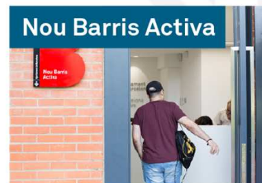
Nou Barris Activa