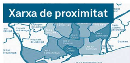
Xarxa de proximitat