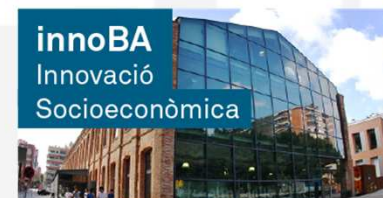
innoBA Innovació Socioeconòmica