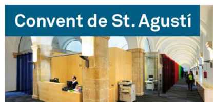
Convent de St. Agustí