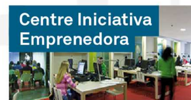
Centre Iniciativa Emprendedora